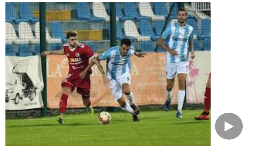
Giana Erminio 1 – Alessandria 1: i goal del match